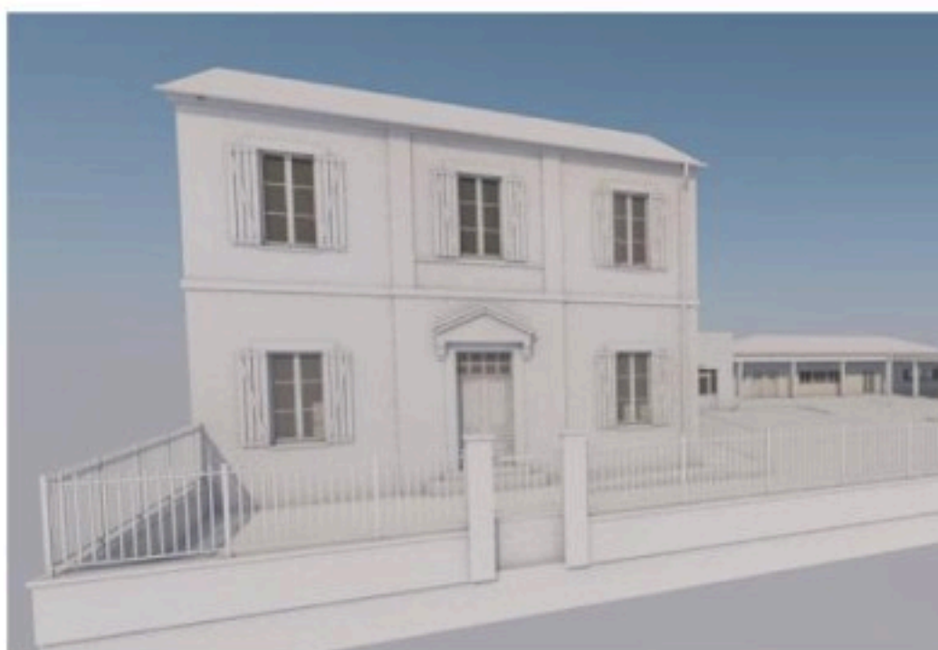
PERSPECTIVE SUR ENTREE